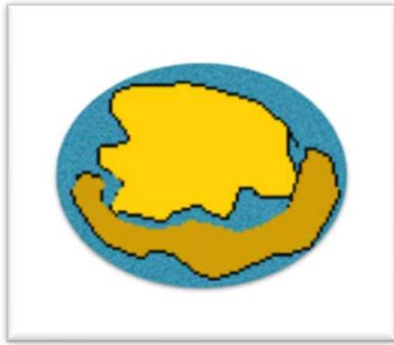
Figura 2. União de indivíduos no nível físico sem nenhuma outra forma de harmonia.

É possível que duas pessoas tenham uma forte atração sexual e ainda se difiram emocionalmente e mentalmente. Essas pessoas podem procurar prazer sexual a todo custo, sem prestar atenção à compatibilidade mental ou emocional.